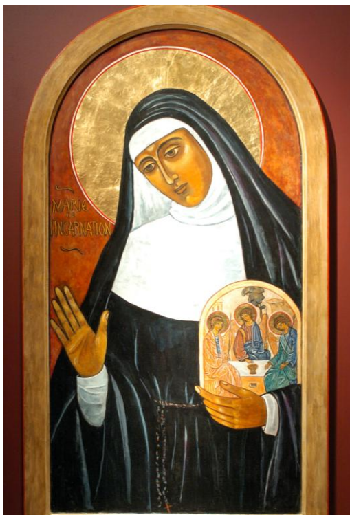
Saint Marie of the Incarnation

orgueil les saints remarquables qui ont vécu la vie consacrée en Nouvelle France - Ste Marie de l'Incarnation, Ste Marguerite Bourgeoys, Ste Marguerite d'Youville, par exemple. Elles ont fondé de nouvelles communautés ou adapté des plus anciennes pour répondre à ceux qui vivaient avec des Canadiens autochtones et des immigrants européens. Tant de choses de notre pays ont été façonnées par ceux qui vivaient la vie consacrée », dit-il. « Leur témoignage, leur vie et leurs services ont été façonnés et purifiés par la vie consacrée. »